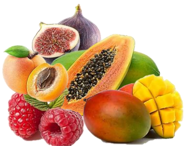
GEMÜSE 20-40% OBST

(NUDELN, GETREIDE HÜLSENFRÜCHTE UND BRAUNER REIS OHNE SALZ)