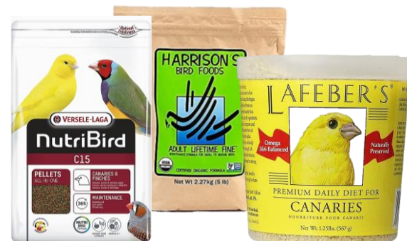
50% AUSGEWOGENE PELLETS